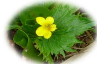
フギレオオバキスミレ